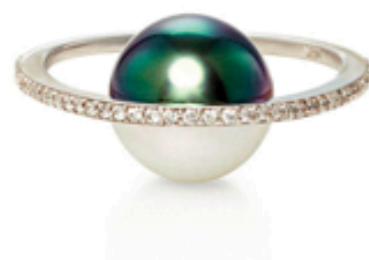
Anillo Diamond Split Pearl Orbit en oro con una perla y carat de diamantes (2.300 € aprox.).

Tu éxito entre los rostros más conocidos es incuestionable; ¿alguna asignatura pendiente en este sentido? Efectivamente, la colección ha tenido mucho éxito, también entre muchos rostros conocidos. Pero lo que más me gustaría es saber que tanto las madres como las hermanas pequeñas se las están robando para ponérselas. Me gustaría que mis piezas llegaran a todas las edades • L. Echávarri