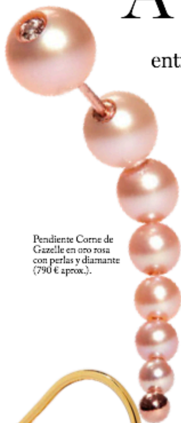
Pendiente Corne de Gazelle en oro rosa con perlas y diamante (790 € aprox.).

Son jóvenes y prometedoras , no entienden de fronteras creativas y están en boca —y en cuellos y muñecas— de todas.