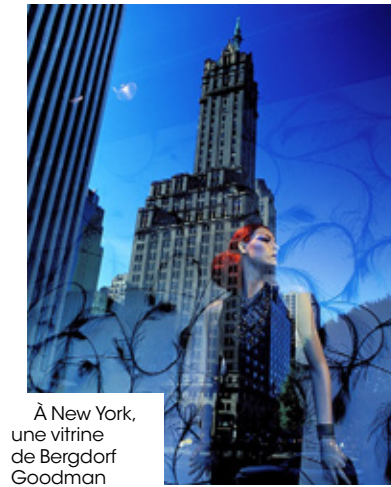
À New York, une vitrine de Bergdorf Goodman (ci-dessus) et Juice Press (ci-dessous).