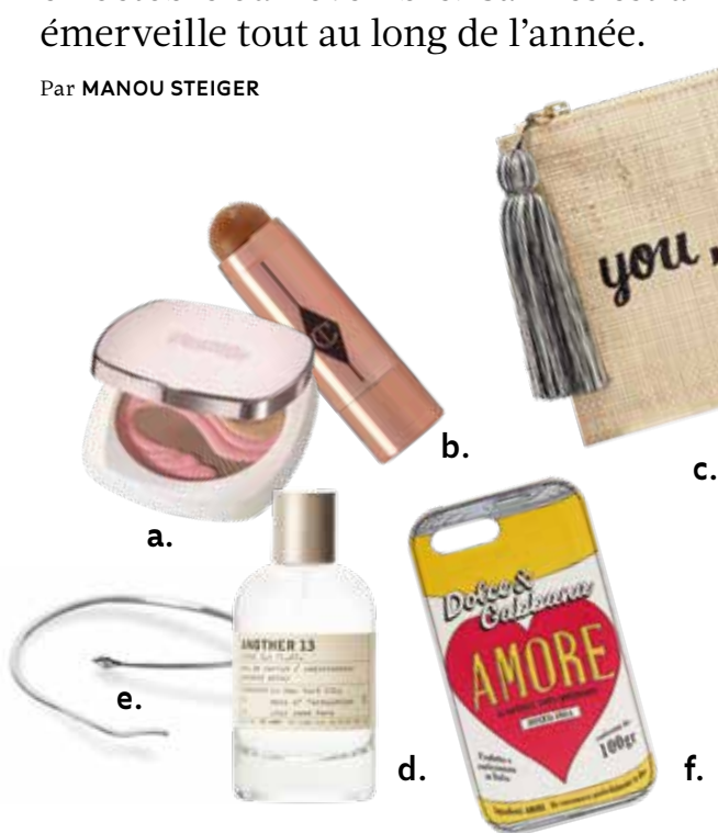
a. Rouge à lèvres, La Mer , CHF 95. b. Stick de bronzage, Charlotte Tilbury , CHF 40. c. Clutch, Kayu CHF 120. Eau de Parfum, Le Labo , 50 ml, CHF 180. e. Bracelet, Nadine Ghosn , CHF 620. f. Coque de smartphone, Dolce & Gabbana , CHF 305.