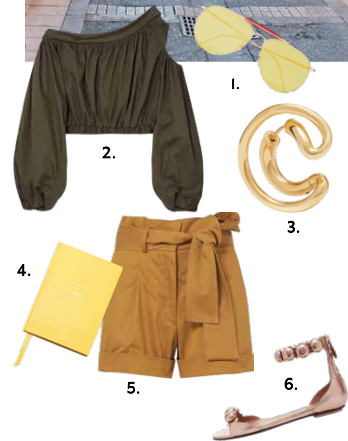
1. Lunettes de soleil, Thom Browne , CHF 640. 2. Top, Silvia Tcherassi , CHF 610. 3. Boucle d'oreilles, Charlotte Chesnais , CHF 350. 4. Carnet de notes, Smythson , CHF 55. 5. Short, Silvia Tcherassi , CHF 550. 6. Chaussures, Azzedine Alaïa , CHF 970.

Les petites boutiques tendance se trouvent à la Rue Menadier.